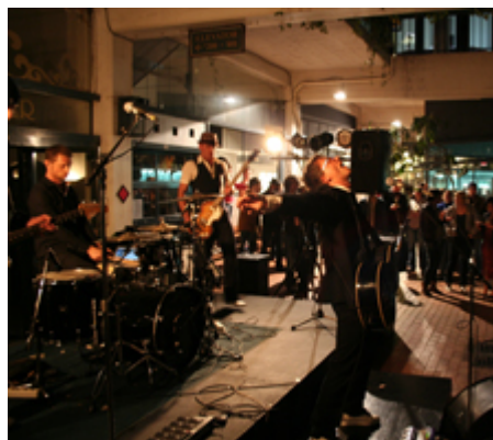
Funky Nashville i den forhenværende fængselsgård.