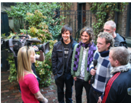
Surfact og lokalt tv-hold.