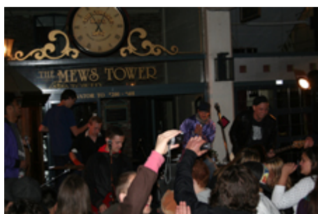
Vincent Van Go Go og medlemmer af The Gypsies briunger festen i hus.