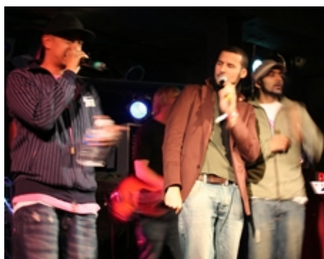
Outlandish holdte fanen og hænderne højt.-